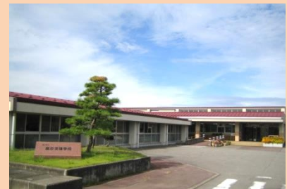
高志支援学校・本校

※学校見学週間、学校参観週間、体験入学のお申込みは、 在籍園（所）・学校を通してお願いします。