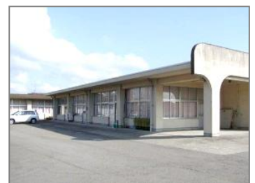
高志支援学校 高等部こまどり分教室